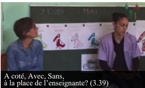
A coté, Avec, Sans, à la place de l'enseignante? (3.39)

Une production collaborative des pôles ressources pédagogiques Mission Ecole Maternelle de l'académie de Versailles 95, 92, 91 et 78