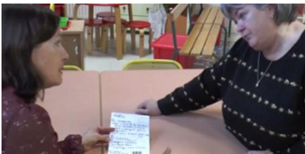
Préparation de classe concertée 1.48