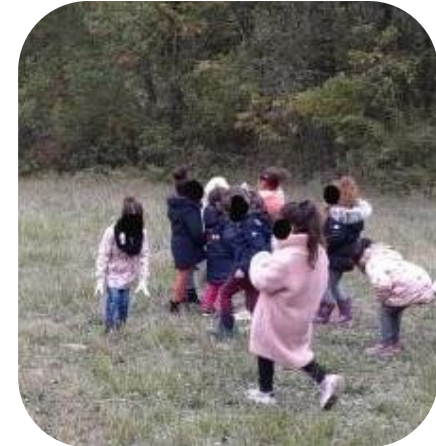
Les enfants ramassent les « trésors » de l'automne.