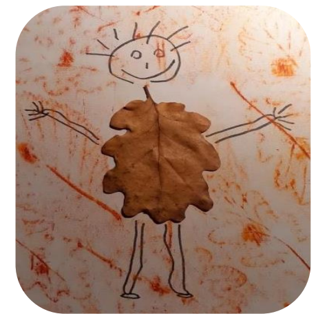
Les trésors ramassés sont utilisés pour réaliser différentes compositions artistiques.