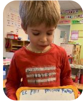
Des enfants investissent l'espace écriture dans lequel ils trouvent des référents en lien avec l'album.