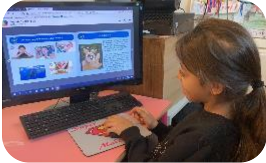
Les enfants écoutent l'histoire dans l'espace ordinateur de la classe. Puis ils ont accès à des petits jeux quand ils connaissent bien l'histoire.