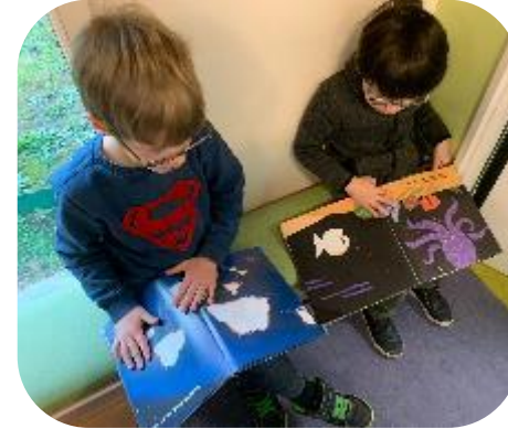
Ils ont le livre à disposition dans l'espace bibliothèque.