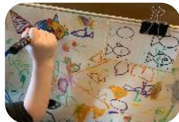
Ils s'entraînent à dessiner les personnages de l'histoire pour créer ensuite leur support.