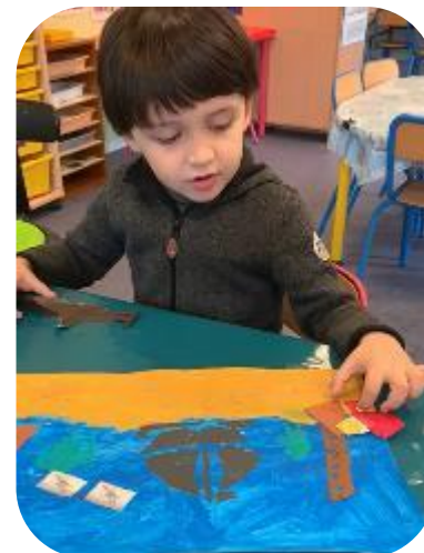
Quand ils se sentent prêts, ils peuvent raconter l'histoire : avec leur support ou le support collectif. Vidéos d'un MS et d'une GS .