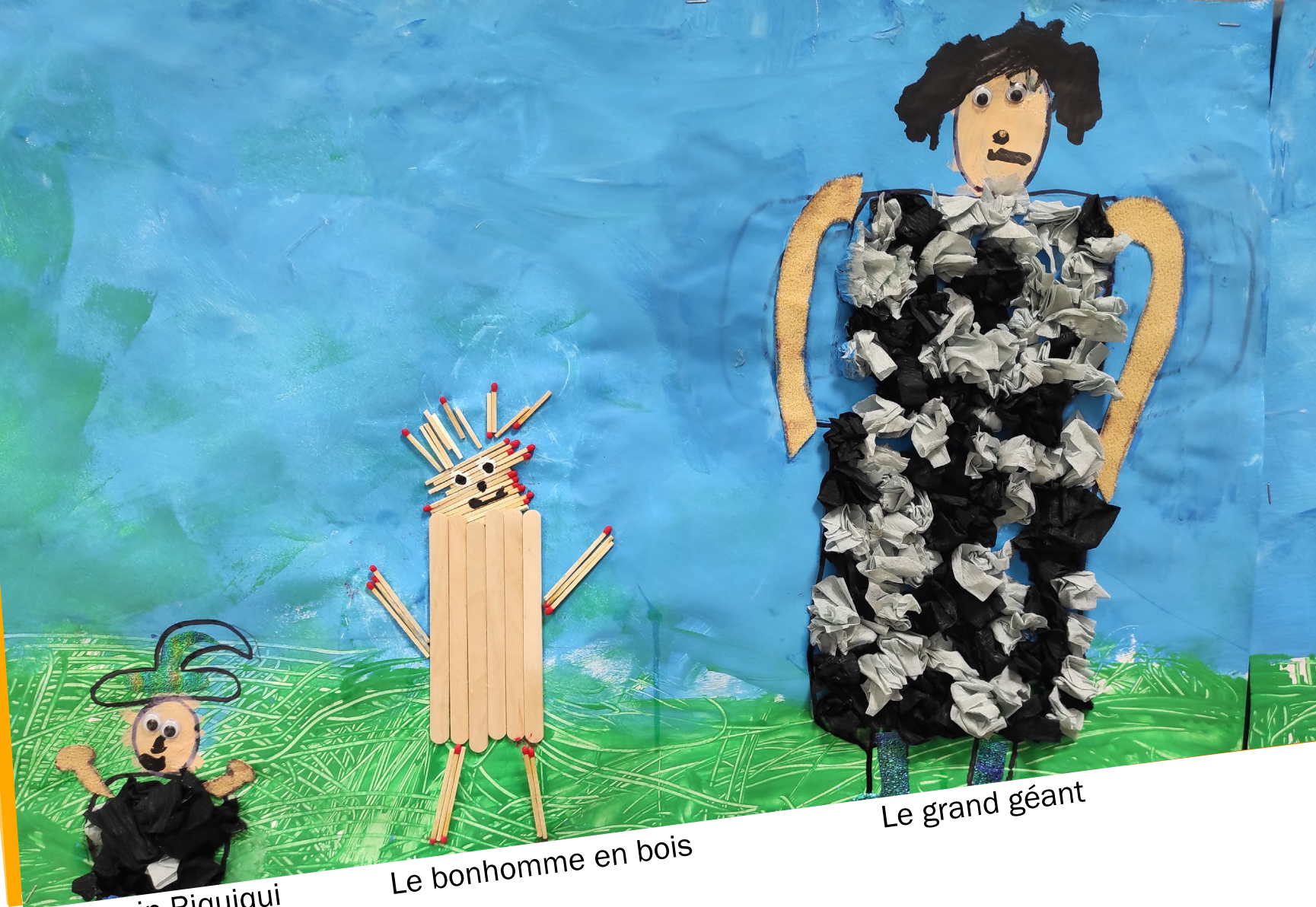
Le nain Riquiqui

L'album « Riquiqui ? » fait par la suite l'objet d'une lecture.