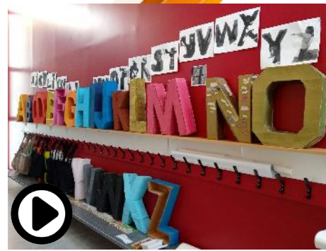
Fabrication de lettres en volumes

Abécédaires réalisés par les enfants visibles dans la classe, dans le couloir, dans l'école