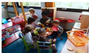
Des jeux d'imitation dès l'accueil