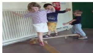
Des activités physiques