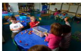
Des activités de tri et de manipulation