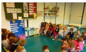
Des activités de langage